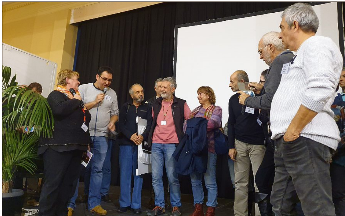
Dans une ambiance comme toujours chaleureuse, les bénévoles de l'association PhotoMenton ont salué la qualité du travail des lauréats et de l'ensemble des exposants.

L'année dernière, les dons de PhotoMenton ont ainsi permis de participer au financement, à hauteur de 5 000€, du projet Sola en République démocratique du Congo pour améliorer les conditions de vie et d'accès à la santé des habitants de cette commune de la province du Katanga. La somme de 2 500€ a également été reversée pour le fonctionnement de l'école Kokologho, au Burkina Faso. « C'est un peu notre école puisqu'elle a été construite grâce à un don de l'association de 10 000€ en 2014. » Depuis la même année, le festival aide également l'associa-