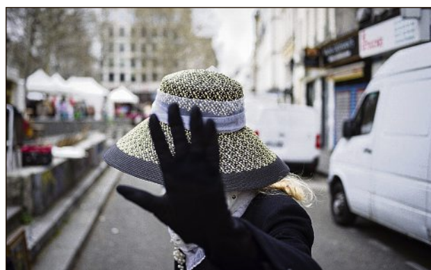
Prise par Pascal Kempenar, cette photo sera utilisée comme affiche de la prochaine édition du festival.